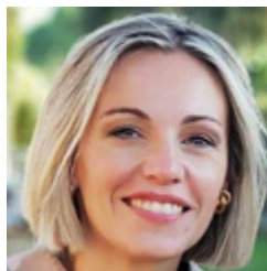
di CHIARA MEOLI Ufficio studi e documentazione Forum Nazionale del Terzo Settore

L'intervento normativo è destinato ai produttori, ai professionisti e agli operatori economici che promuovono iniziative commerciali a finalità solidale; i suoi effetti si riflettono in una qualche misura anche sugli enti del Terzo settore, che rappresentano i principali destinatari dei benefici derivanti da tali campagne. Da un punto di vista strettamente giuridico, la normativa non introduce obblighi formali a carico degli enti beneficiari. Tuttavia, essa incide in modo significativo sul contesto nel quale questi soggetti operano, ridefinendo le modalità di collaborazione con imprese, influencer e altri operatori coinvolti nelle iniziative promozionali. La riforma si fonda infatti su un rafforzamento dei principi di trasparenza e correttezza informativa, nella consapevolezza che la reputazione e l'affidabilità dell'ente beneficiario costituiscono fattori determinanti nelle scelte dei consumatori. In questo nuovo quadro regolatorio, gli enti del Terzo settore sono chiamati a prestare attenzione ai comportamenti dei produttori e/o professionisti partner e al loro corretto adempimento di quanto previsto dalla nuova norma, anche adottando strumenti contrattuali adeguati contribuendo così a preservare la credibilità dell'iniziativa e la tutela dei consumatori.