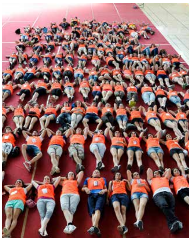
foto: © Mario Vintari Progetto FIAF-CSVnet "Tanti per tutti. Viaggio nel volontariato italiano"

quota di coloro che non fanno sport, maggiore per le donne rispetto agli uomini (38,2% vs 23,5%) e per le persone di mezza età (40,7% tra i 45 e i 54 anni, 37,5% per gli over 55) e gli over 65 (54,8%). I principali inibitori alla pratica dello sport sono scarsa pazienza/costanza, pigrizia e mancanza di tempo libero da dedicare. Ogni segmento ha le proprie motivazioni: per gli uomini di mezza età è più una questione di tempo e stanchezza, per le donne di costanza, per i giovani di pigrizia o assenza di tempo, per gli over 65 anche di motivi di salute.