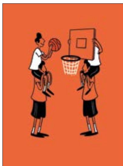
in copertina PAREGGIO illustrazione di Ilaria Grimaldi